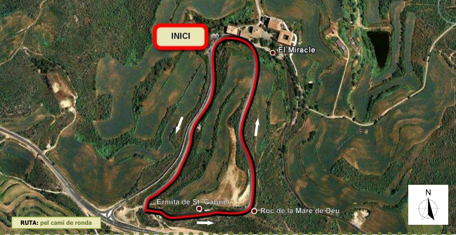
RUTA: pel camí de ronda