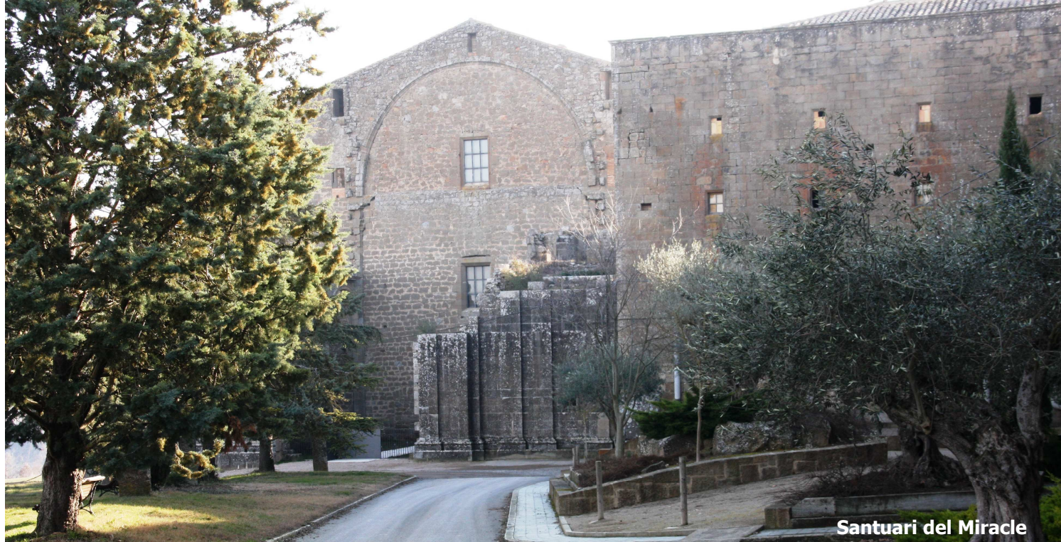
Santuari del Miracle